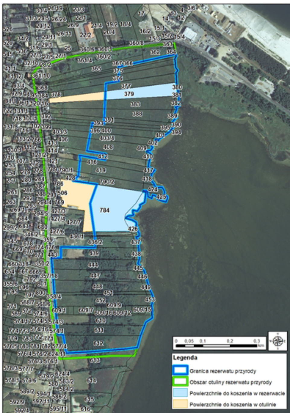
Rysunek 2. Miejsce prowadzenia prac

Na pozostałych powierzchniach w rezerwacie przyrody oraz jego otulinie, na powierzchni ok. 16 ha, od roku 2017 wykaszanie prowadzi Gmina Władysławowo.